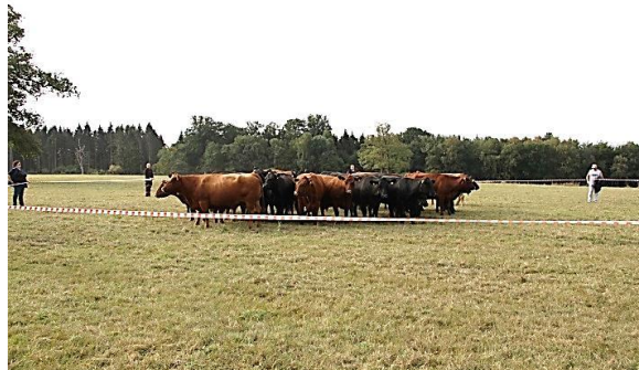
Bildunterschrift: Die Teilnehmer lernen das sichere Trei- ben der Rinder.

In 13 weiteren kurzen Schulungsfilmern der SVLFG auf YouTube kann sich der Landwirt oder Betriebshelfer künftig ohne großen Aufwand zu Detailthemen informie- ren. Themen dieser Kurzfilme sind unter anderem die Wahrnehmung von Rindern, sicheres Treiben, sichere Verladung, Sicherheit am Melkstand oder der Fangstand. SVLFG